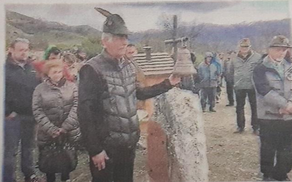
Il suono della campana della memoria da parte degli alpini